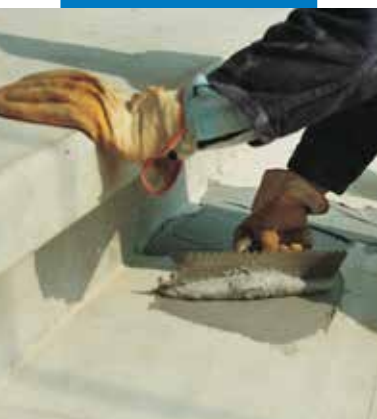
Aplicación de Adesilex PG1 con una llana dentada para la fijación estructural de pisos prefabricados