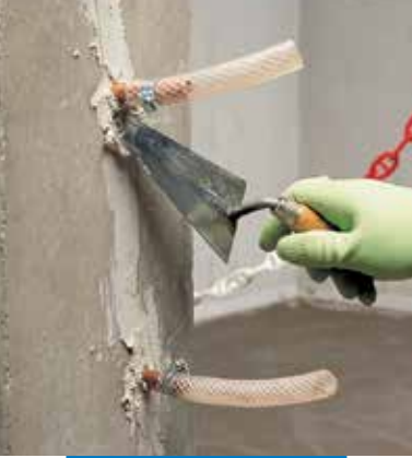
Fijación de tubos de inyección y sellado de grietas para la consolidación estructural