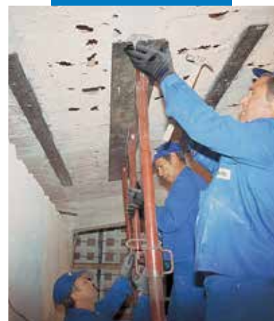
Colocación de chapa para el refuerzo estructural