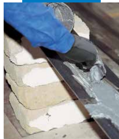
Aplicación de Adesilex PG1 en láminas de metal