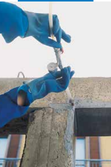
Columna revestida con Adesilex PG1